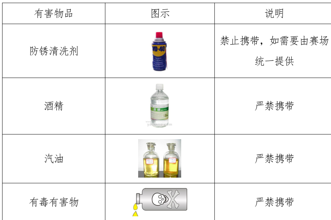
表 6 受限有毒有害物品清单